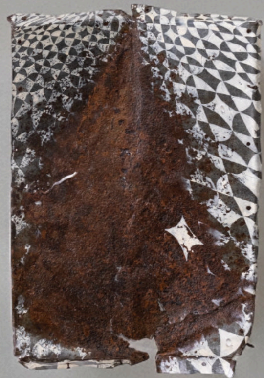
Quel Sentiero Nel Pavimento, 50x34 cm, olio su ferro, 2022