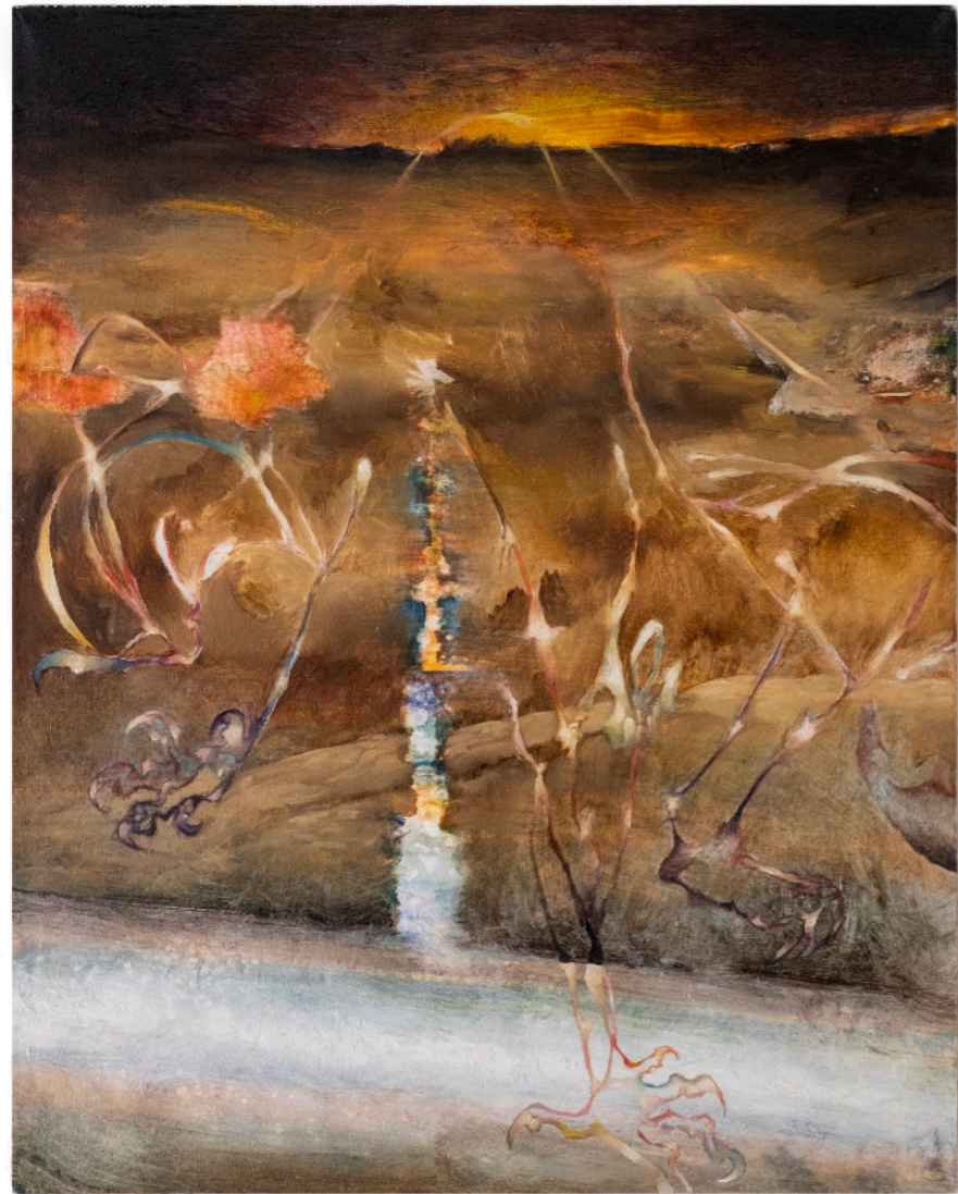
Aspetta Sempre Vicino La Ferita, 50x40 cm, acrilico e olio su tela, 2024