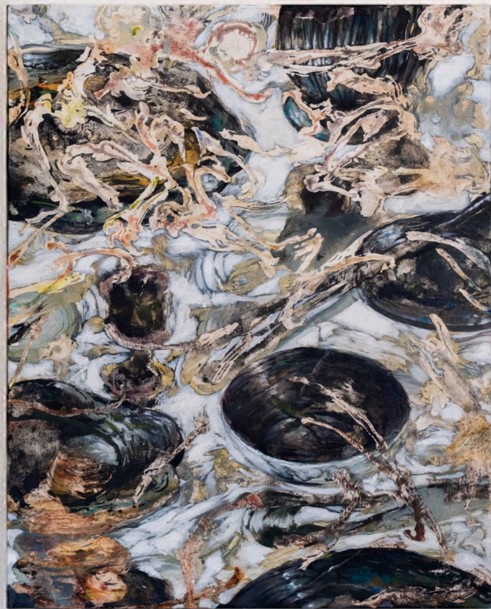
Litigarsi L'Ultimo Osso, 50x40 cm, acrilico e olio su tela, 2024