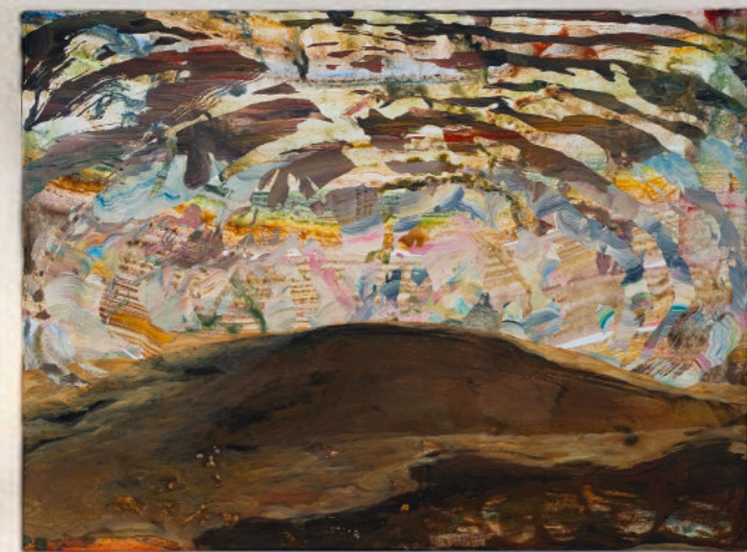
Un Cielo Spaccato, 60x80 cm, acrilico e olio su tela, 2023