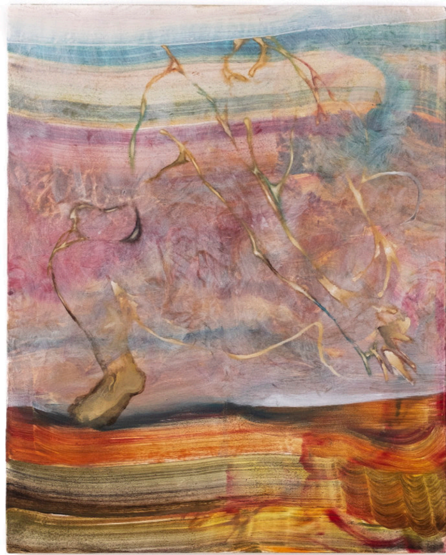
Attenzione! Scotta, 50x40 cm, acrilico e olio su tela, 2023