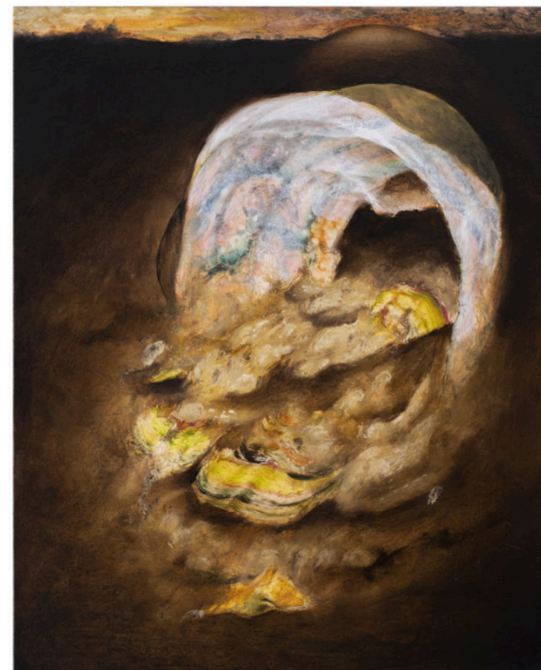
Per Far Crescere Fiori Su Terra Bruciata, 50x40 cm cad, acrilico e olio su tela, 2024