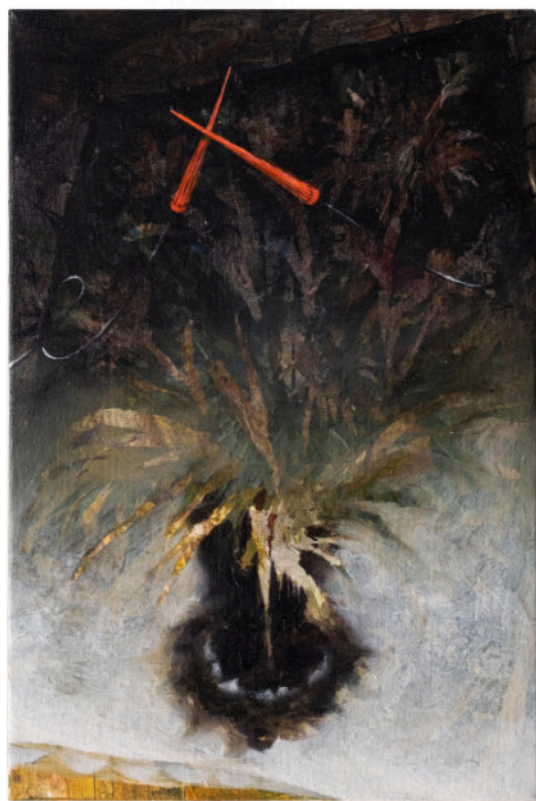
Pioggia Sintetica, 30x20 cm, acrilico e olio su tela 2024