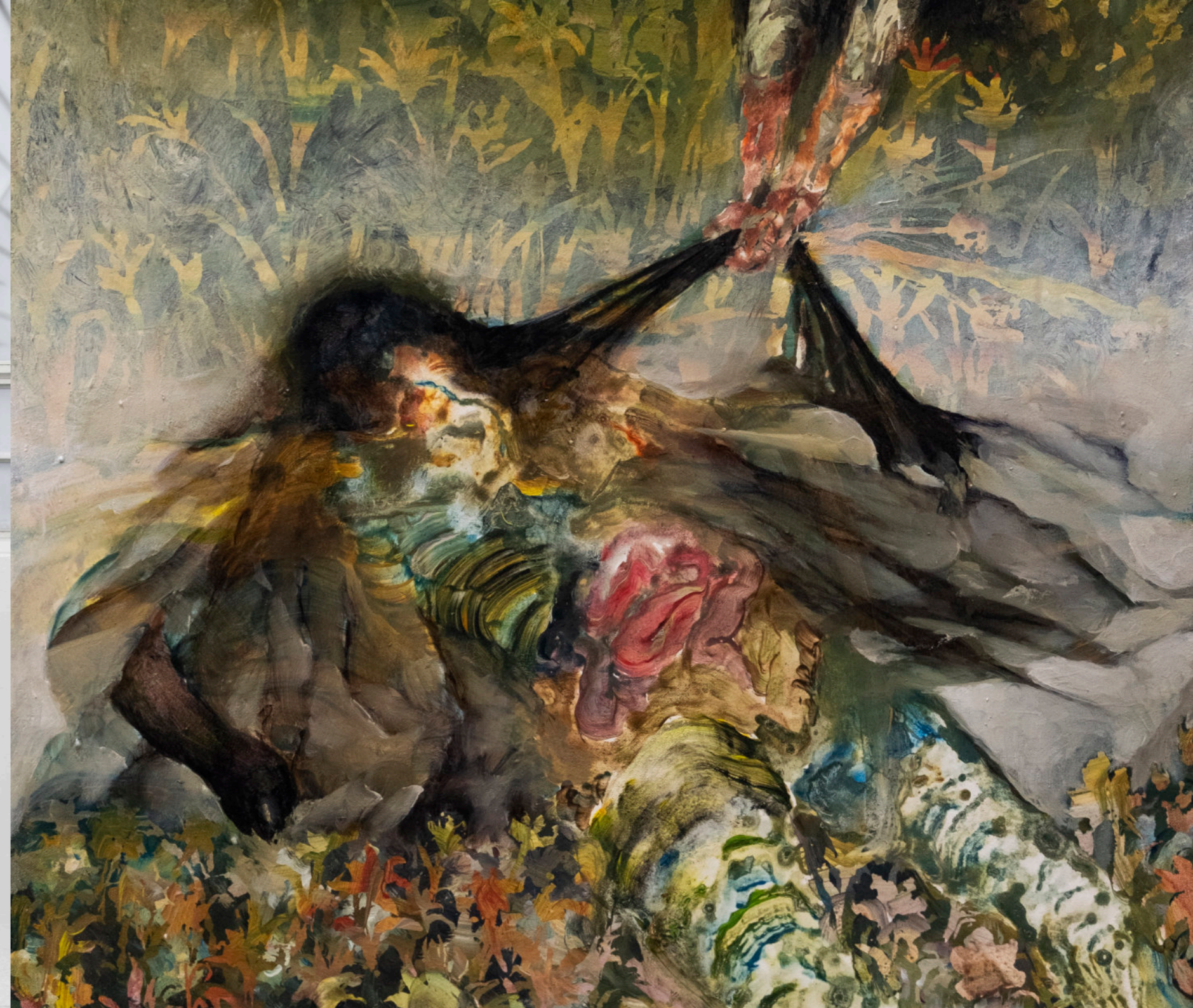
Stagione Di Pulizie, 50x40 cm, acrilico e olio su tela, 2024