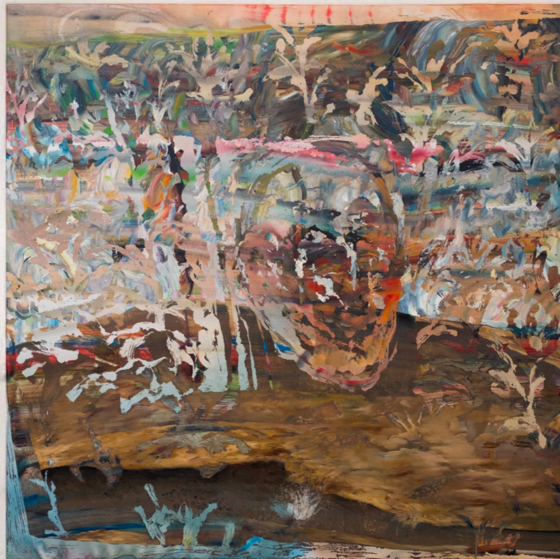
Orizzonte Al Livello Del Campo, 150x150 cm, acrilico e olio su tela, 2023