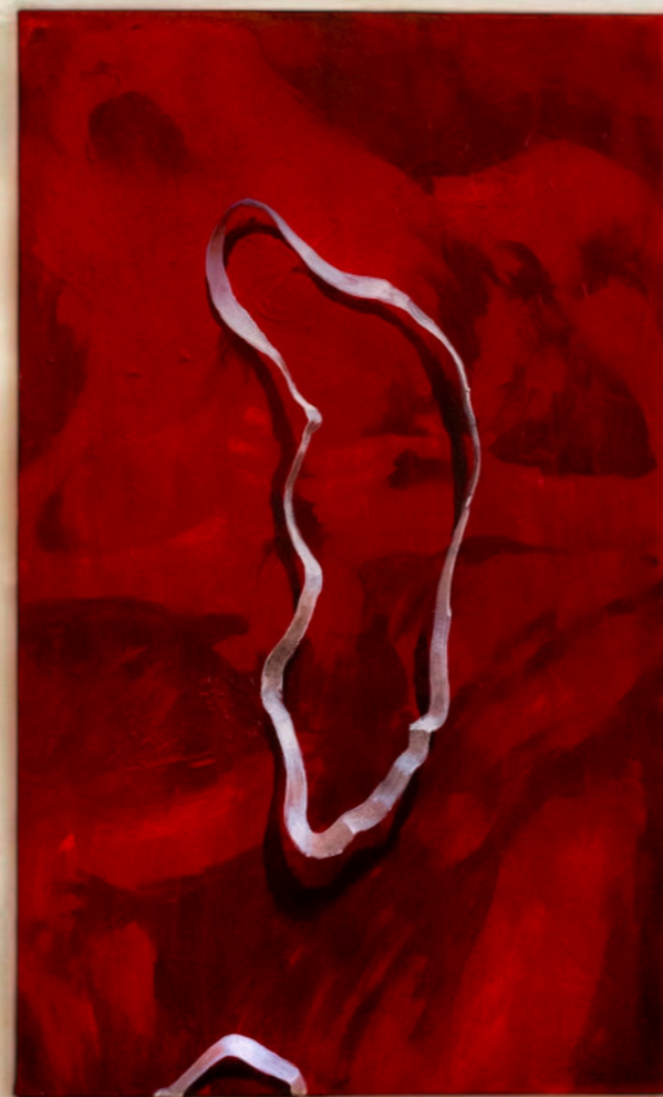
OH NO, 50x30 cm, acrilico su tela, 2022