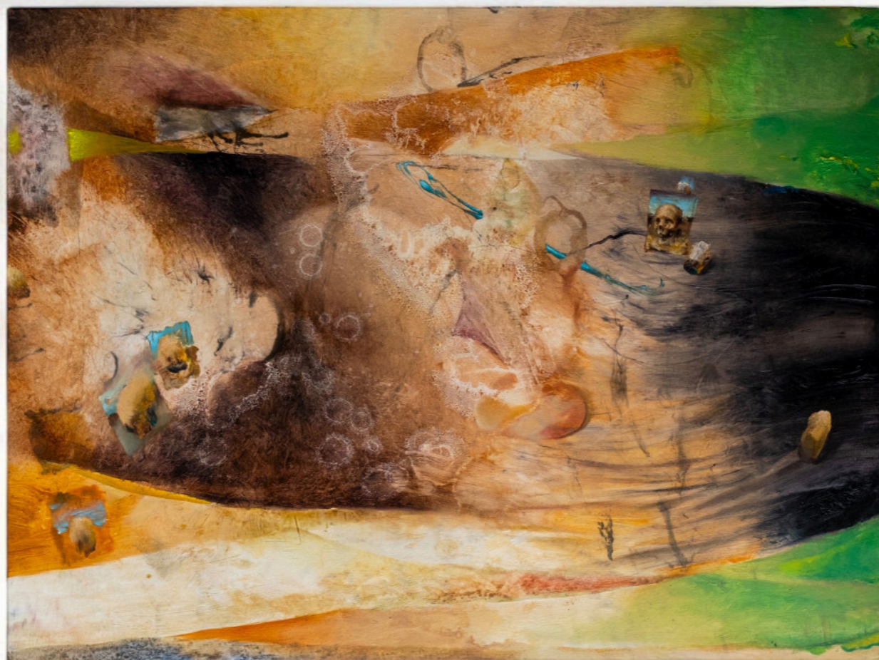
Giochi Di Memoria, 60x80 cm, acrilico e olio su tela, 2024