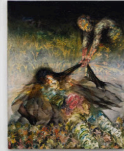
Mille Teste Per Una Maschera, 200x200 cm, acrilico e olio su tela, 2023