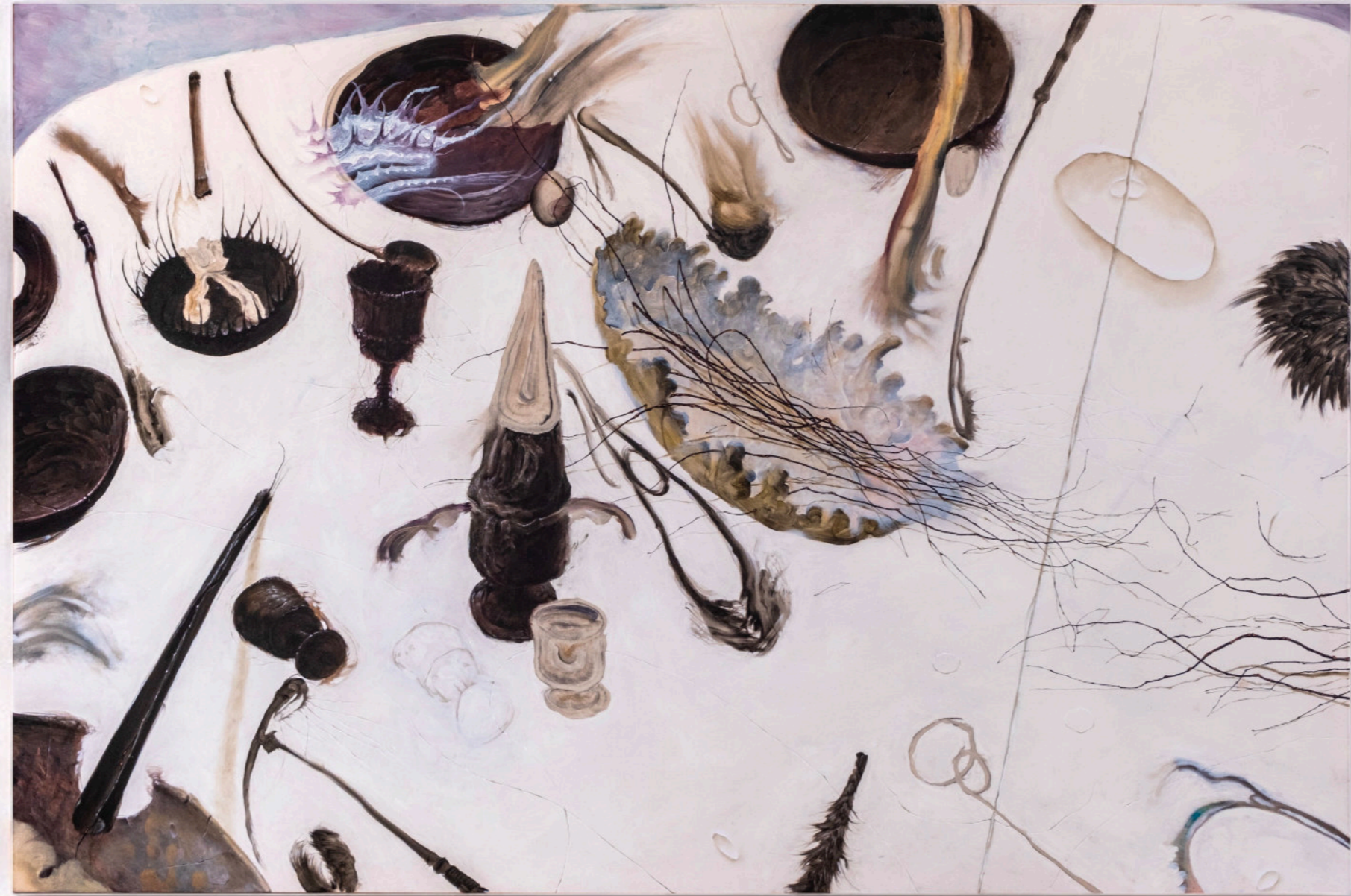
Non Hanno Lasciato Altro Che Graffi, 100x150 cm, olio su tela, 2022