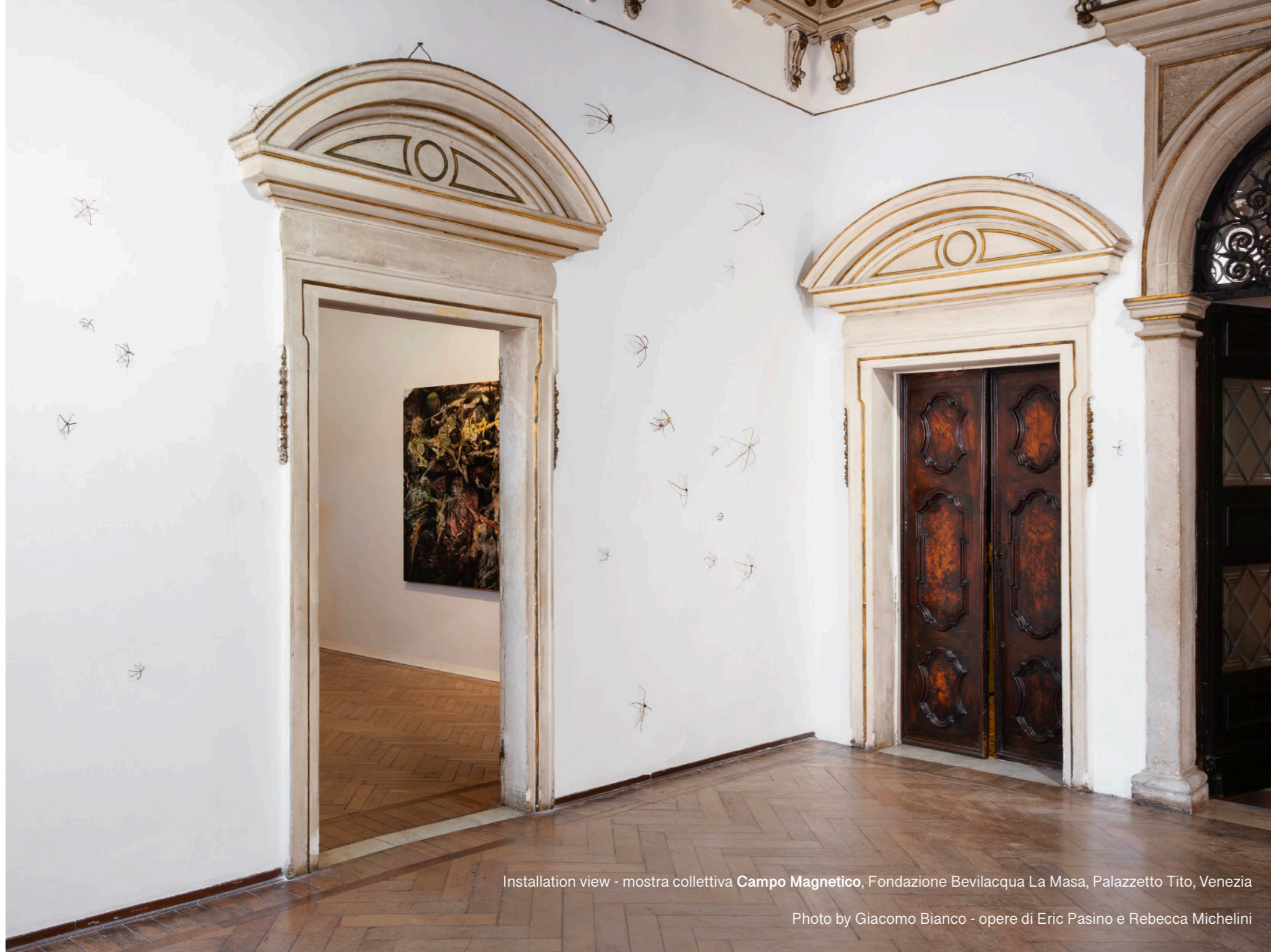
Installation view - mostra collettiva Campo Magnetico , Fondazione Bevilacqua La Masa, Palazzetto Tito, Venezia