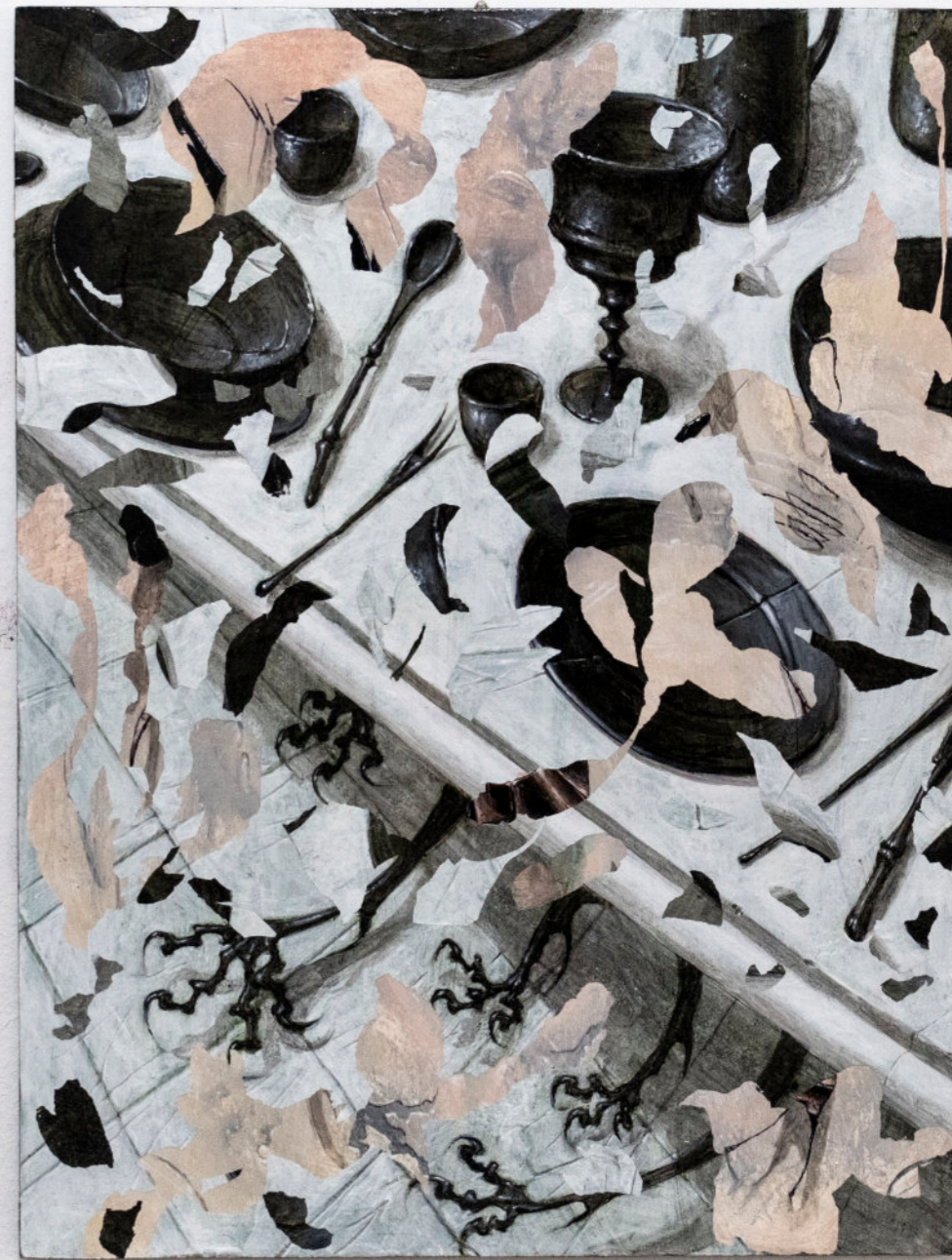
Artigli Neri, 52,5x40 cm, acrilico su tavola, 2021