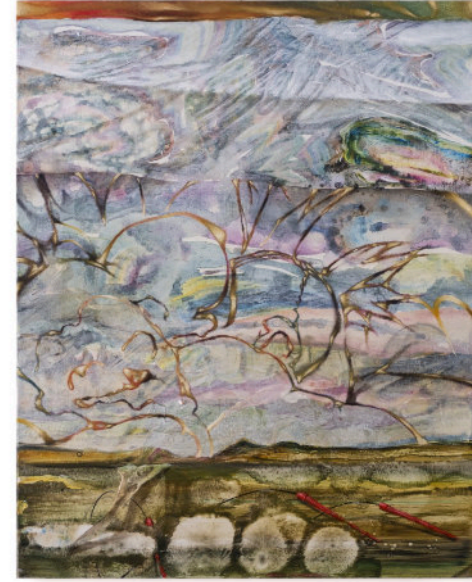
Per Far Crescere Fiori Su Terra Bruciata, 50x40 cm cad, acrilico e olio su tela, 2024