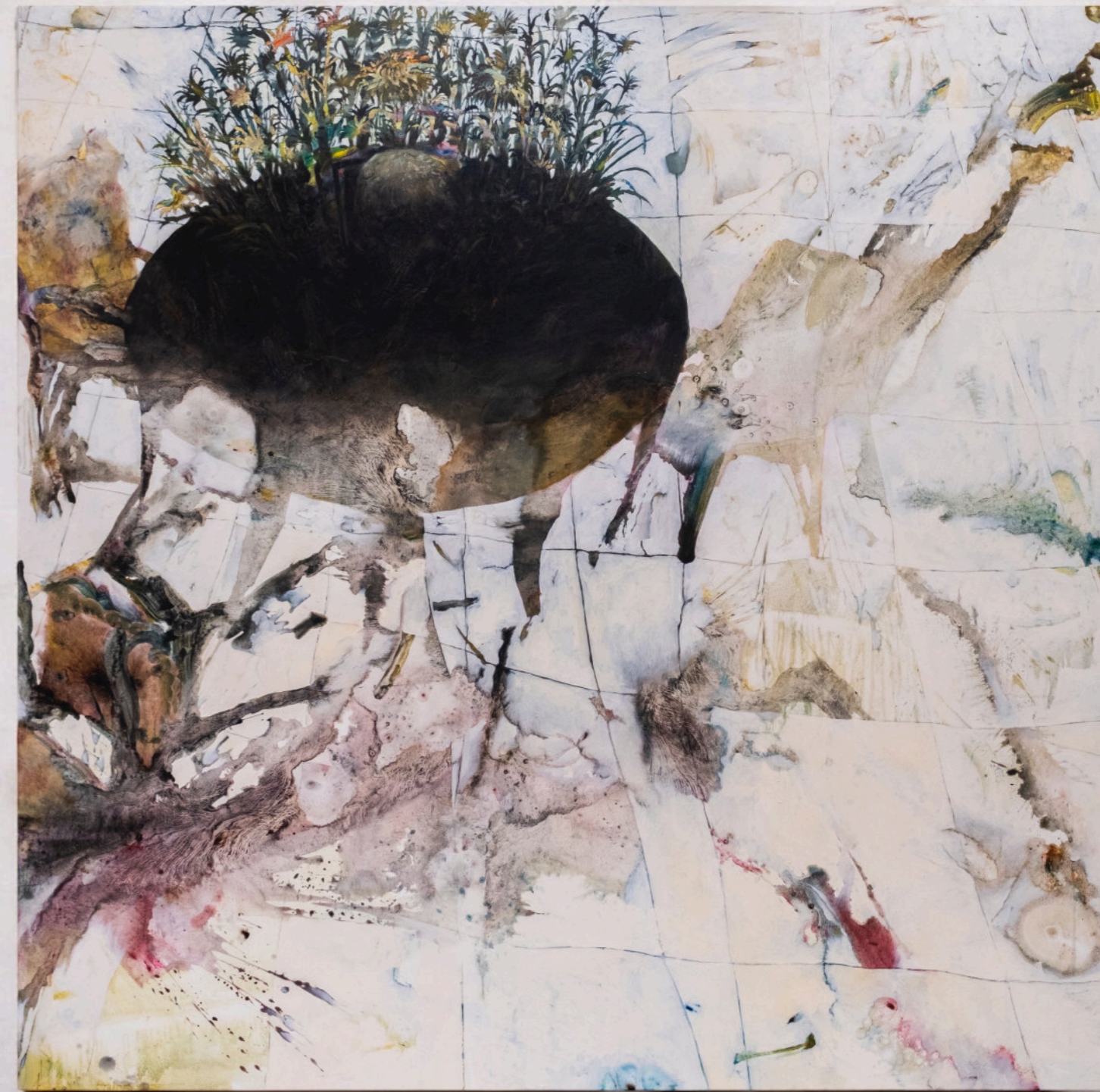
Il 30 Dicembre. 190x190cm, Acrilico e olio su tela, 2024