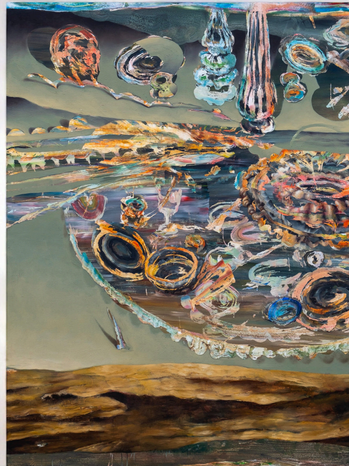
Dopo La Festa Dei Graffi, 200x150 cm, acrilico e olio su tela, 2023