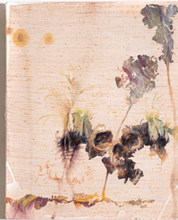
Diaspora, 50x35cm, olio e vinavil su tela, 2023