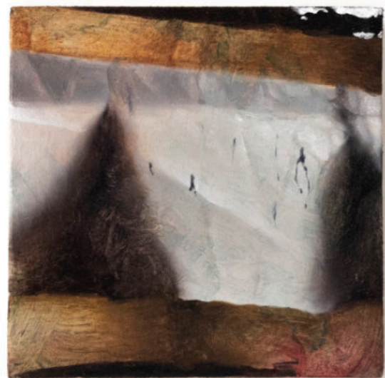
Per Altre Costruzioni, 15x15 cm, olio su tela, 2023