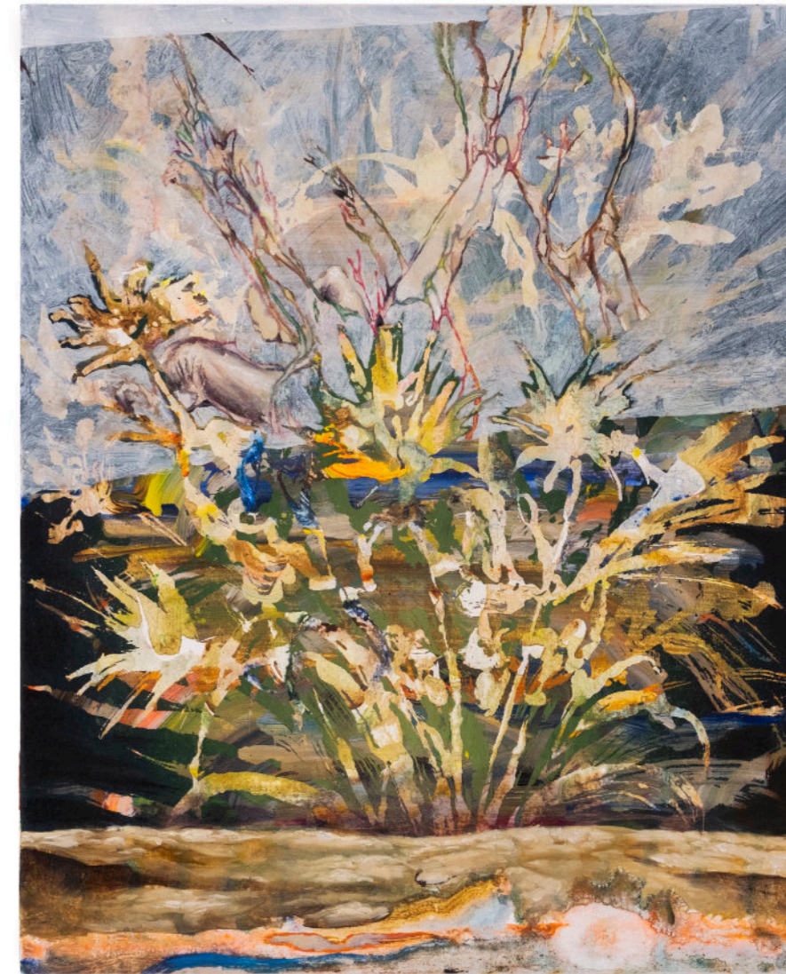
Per Un Pugno Di Fiori, 50x40 cm, acrilico e olio su tela, 2024