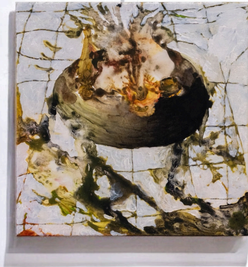
Due Apparizioni Sul Tavolo Della Cena, 20x20 cm, acrilico e olio su tela, 2024