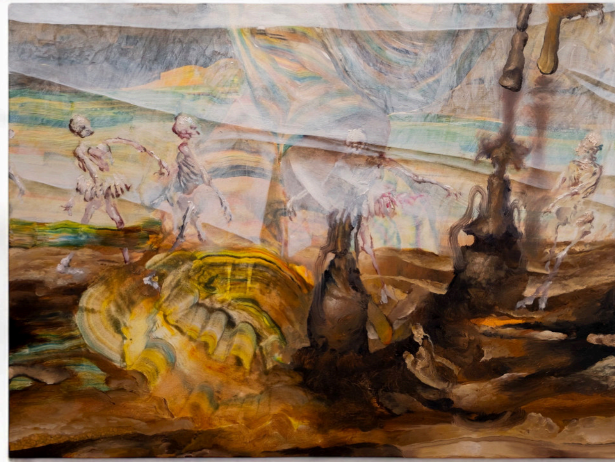
Danza Dall'Altra Parte Del Velo, 60x80 cm, acrilico e olio su tela, 2024