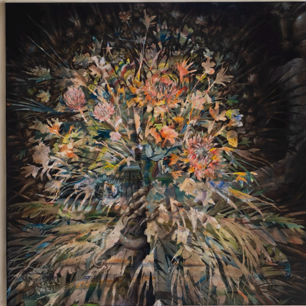
Proposte Indecenti, 150x150 cm, acrilico e olio su tela 2023