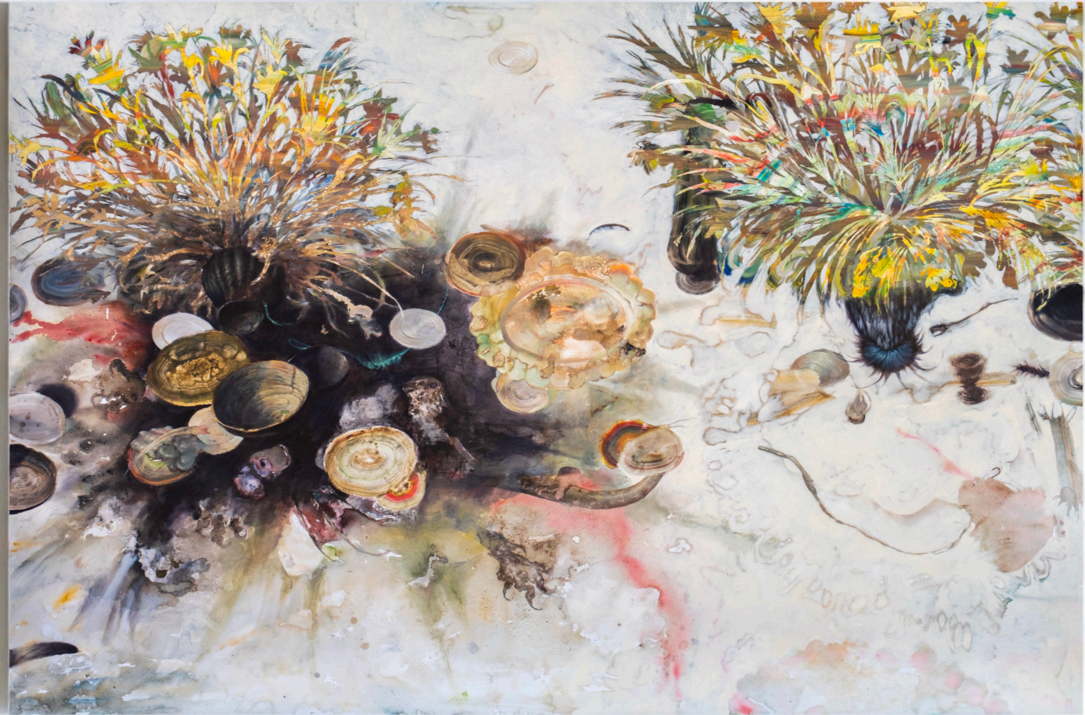
Pur Di Eliminarlo Avremmo Dato Fuoco All'Intera Casa, 200x300 cm, acrilico e olio su tela, 2023