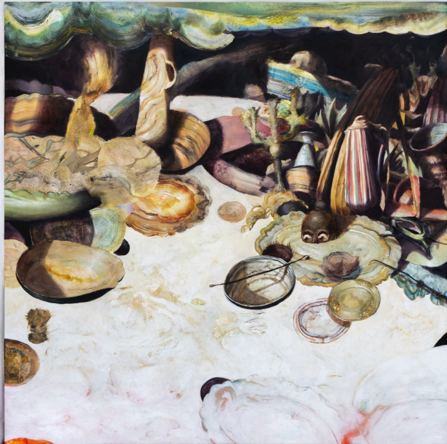
Feste Segrete, 190x190 cm, acrilico e olio su tela, 2023