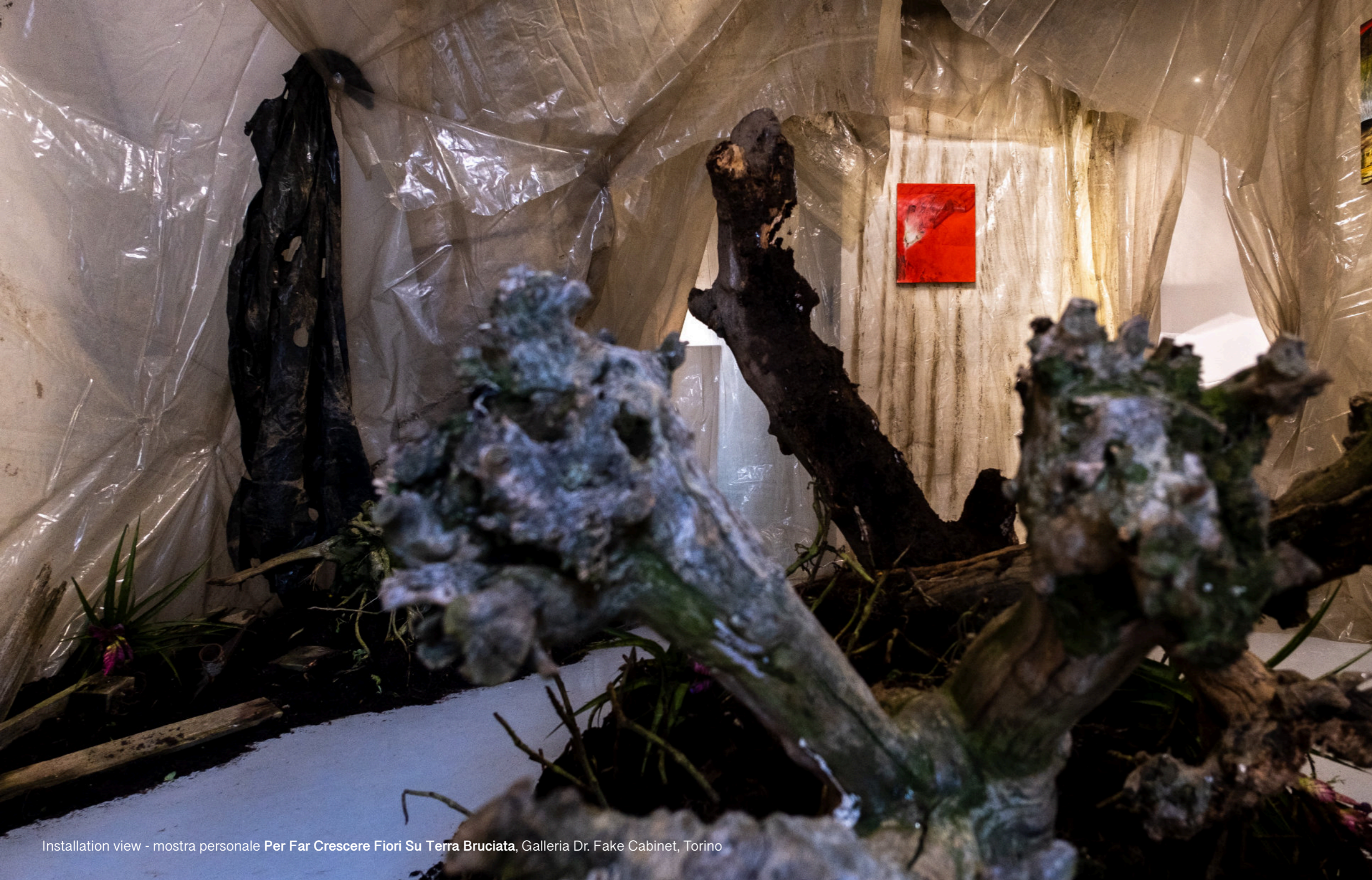
Installation view - mostra personale Per Far Crescere Fiori Su Terra Bruciata, Galleria Dr. Fake Cabinet, Torino