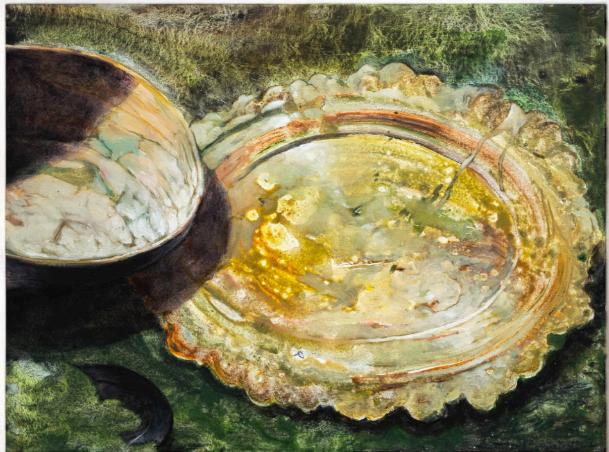
La Luna E Il Sole, Sporchi E Abbandonati, 60x80 cm, acrilico e olio su tela, 2023