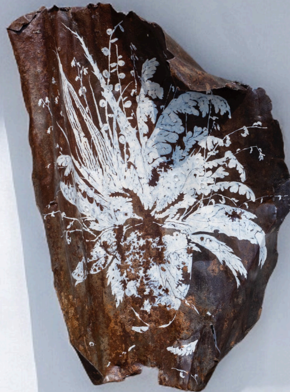
Una Foglia Di Quercia Sul Marciapiede, 93x60 cm, olio su ferro, 2022