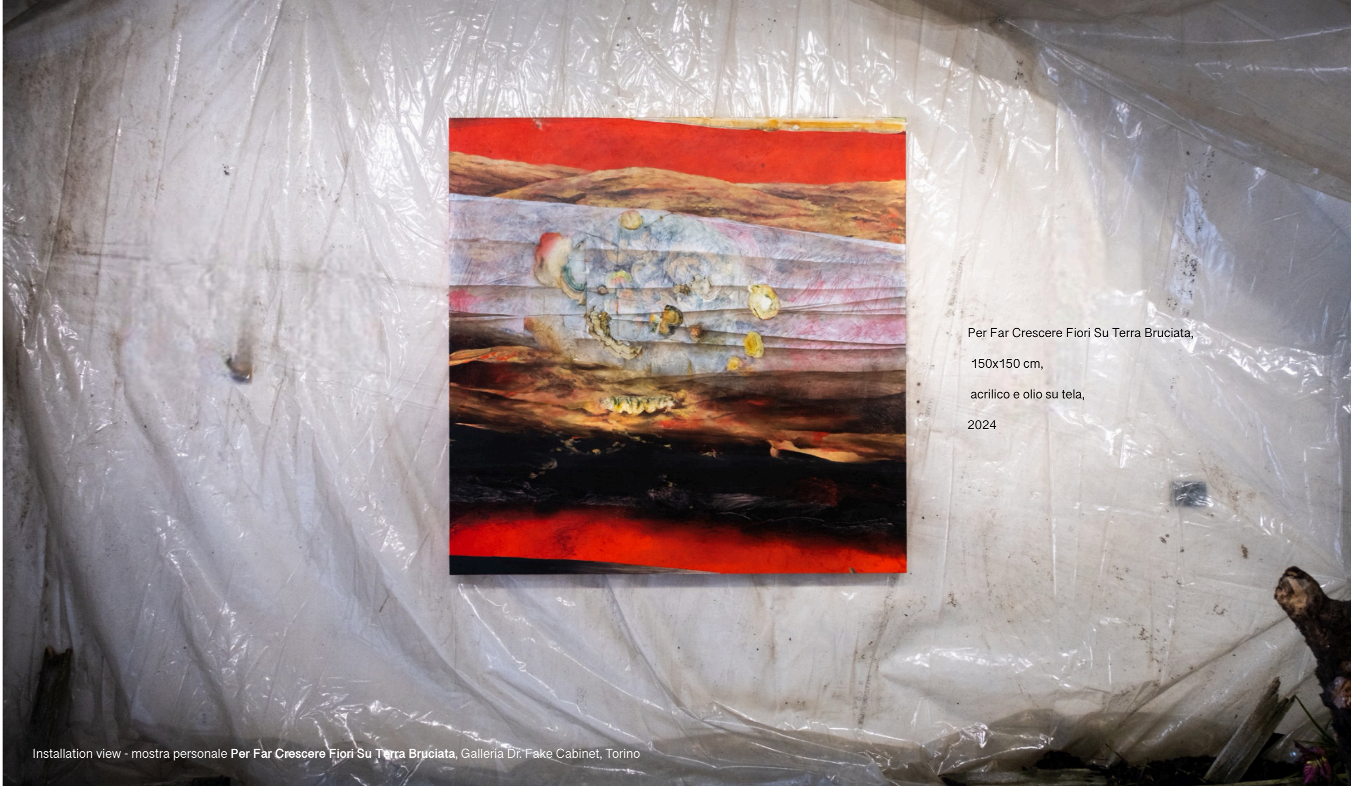
Per Far Crescere Fiori Su Terra Bruciata, 150x150 cm, acrilico e olio su tela, 2024