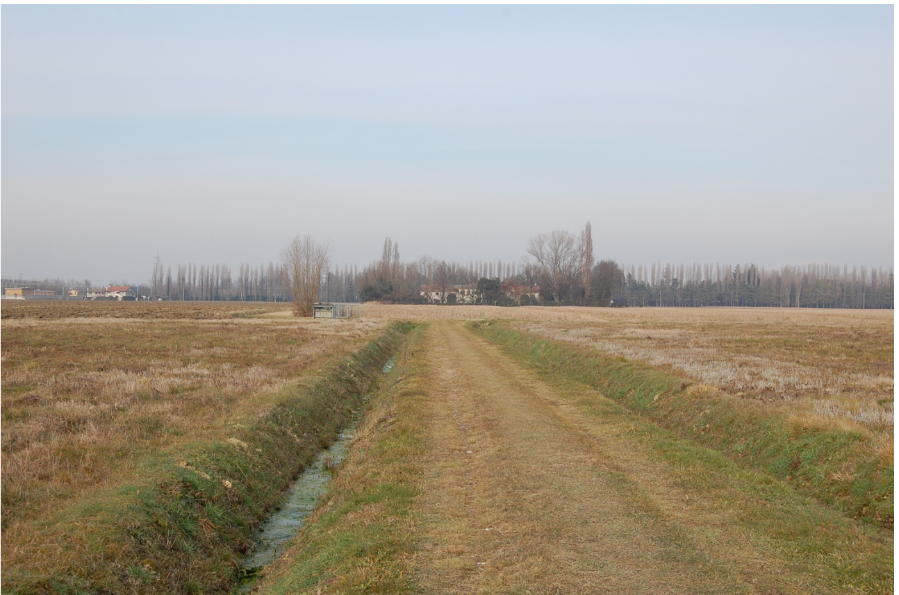
Vista nuovo Cono Visuale a sud in via dei Mille (visuale ristretta)