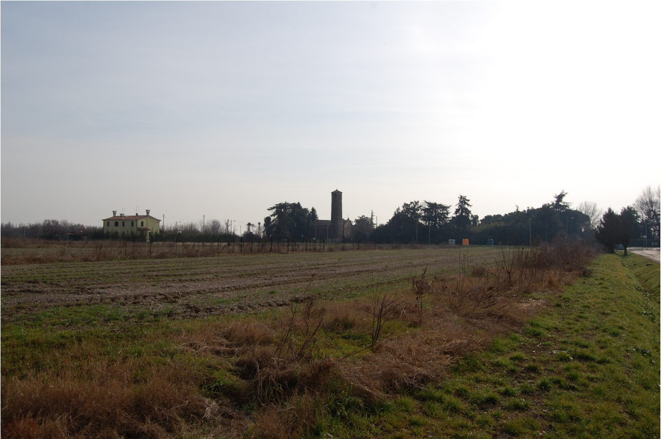
Vista nuovo Cono Visuale Torre di Tessera a nord in via Torre Antica (Tessera)