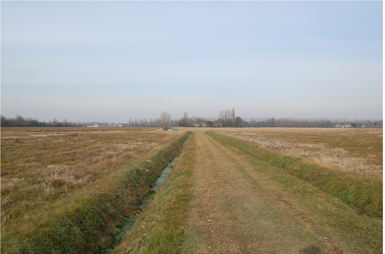
Vista nuovo Cono Visuale a sud in via dei Mille