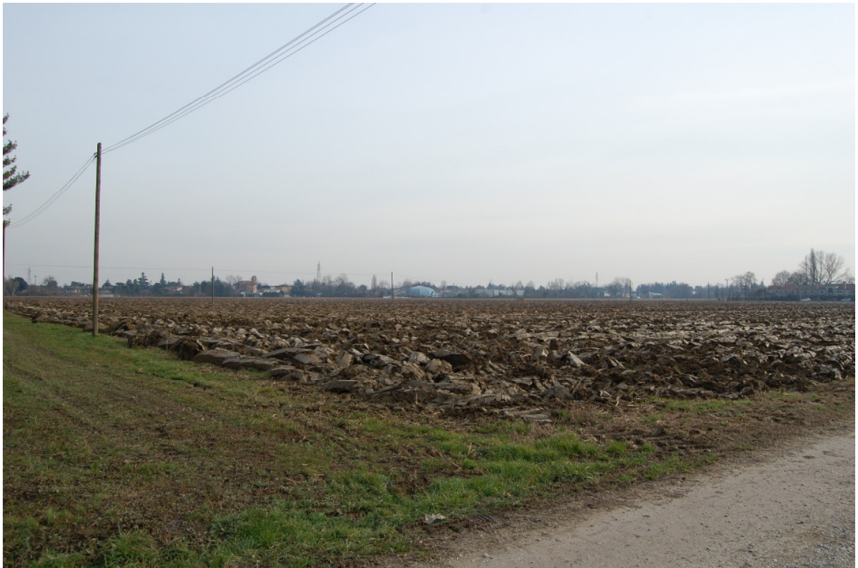
Vista Cono Visuale a nord in via Tre Garofani (inserimento seconda area a sinistra)