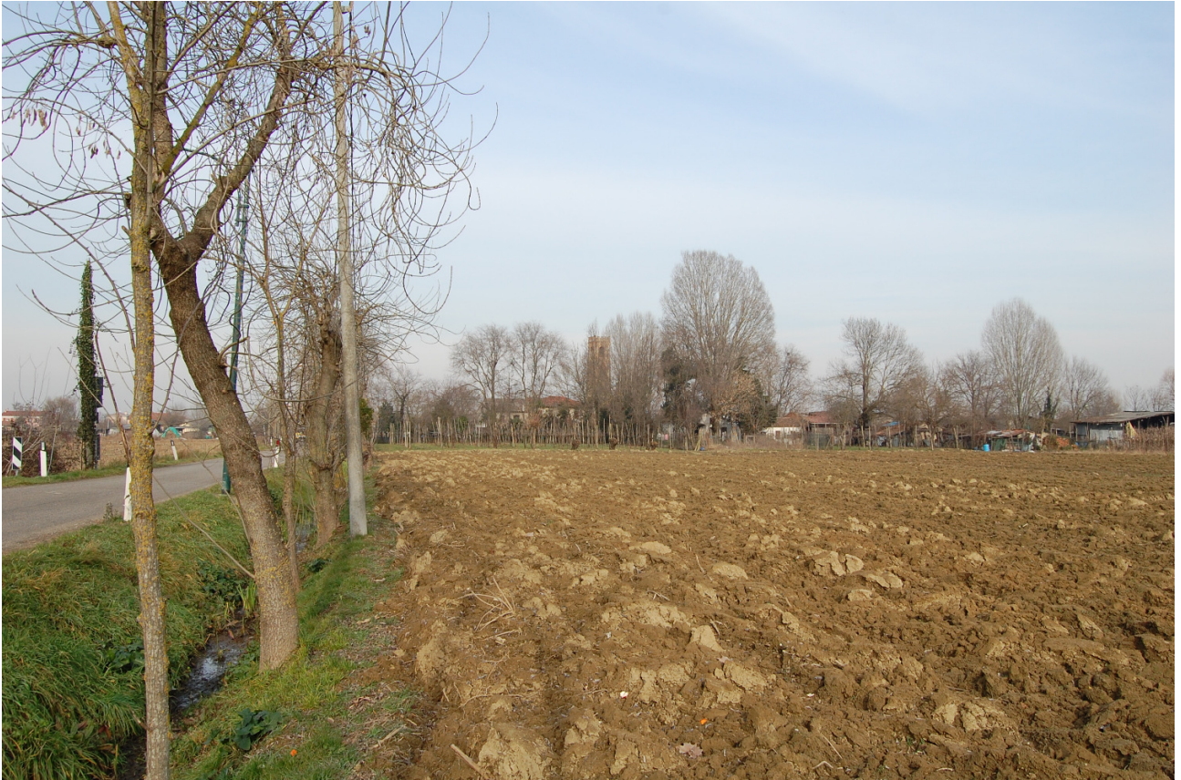
Vista nuovo Cono Visuale Torre di Dese a sud in via Ca' Colombara – a fianco del Cimitero