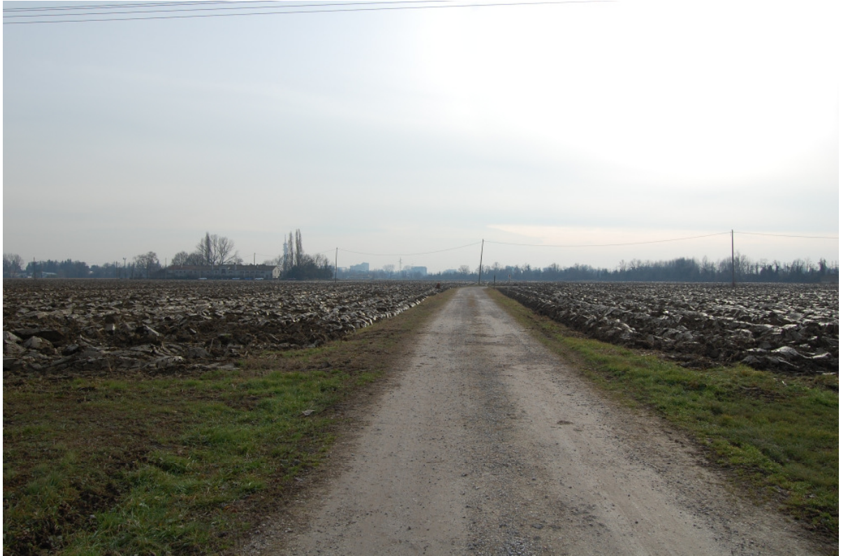
Vista Cono Visuale a nord in via Tre Garofani (inserimento prima area a destra)