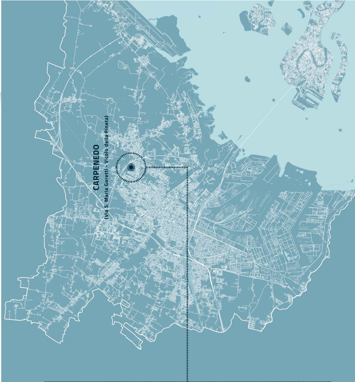
PERIMETRO SCHEMA DI UTILIZZAZIONE