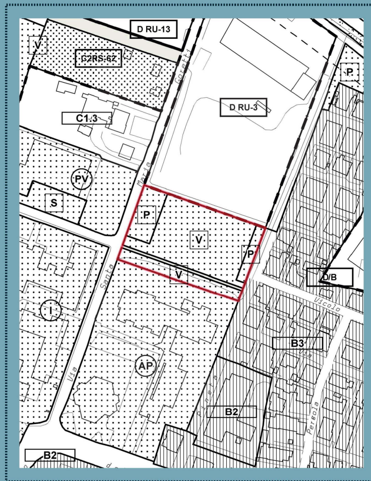
VPRG per la Terraferma (approvata con DGRV 3905/2004 e DGRV 2141/2008)