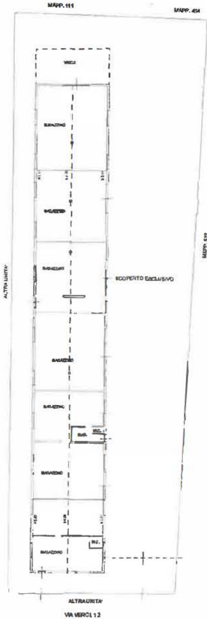
PIANTA PIANO TERRA h m. 3.50

Protocollo Comune di Venezia c_1736 PG/2024/0618073 del 17/12/2024 - Pag. 5 di 7