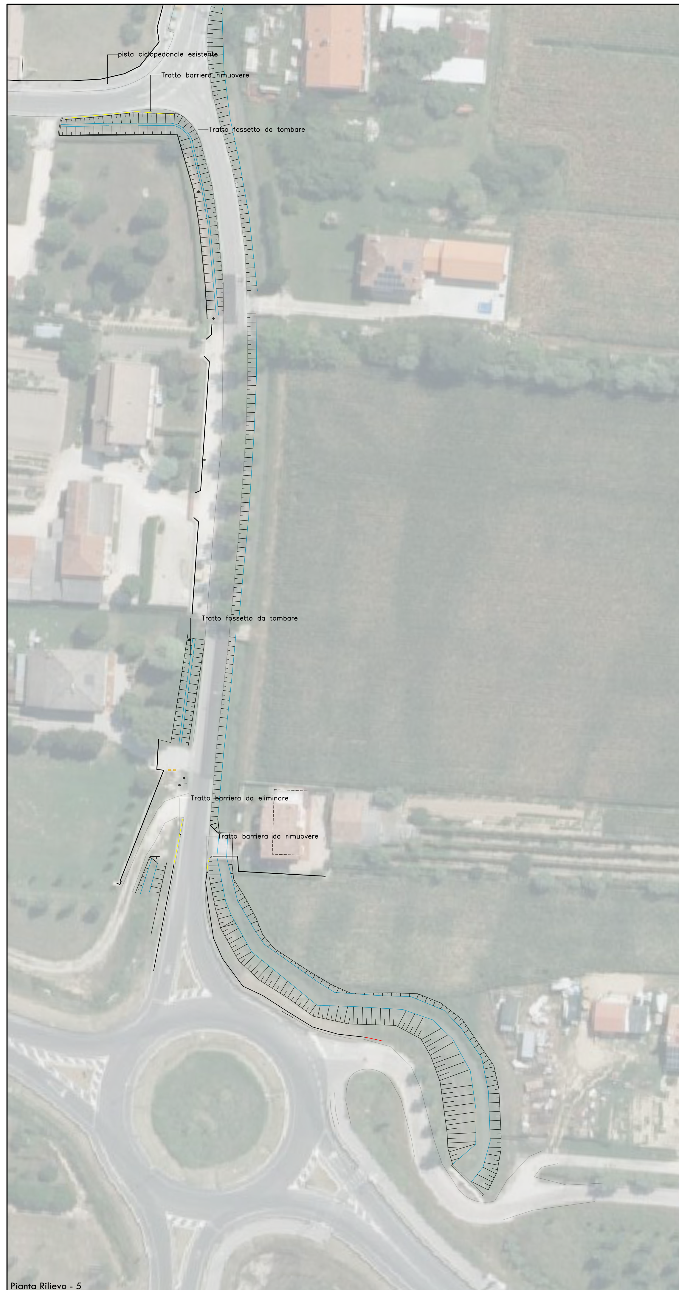
Pianta Rilievo - 5