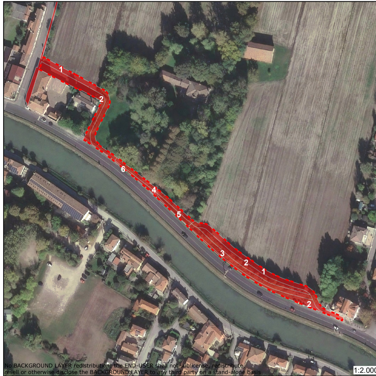
Tavola di Variante al P.I n.105