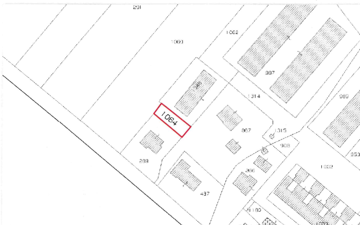
Estratto mappa dell'area in oggetto